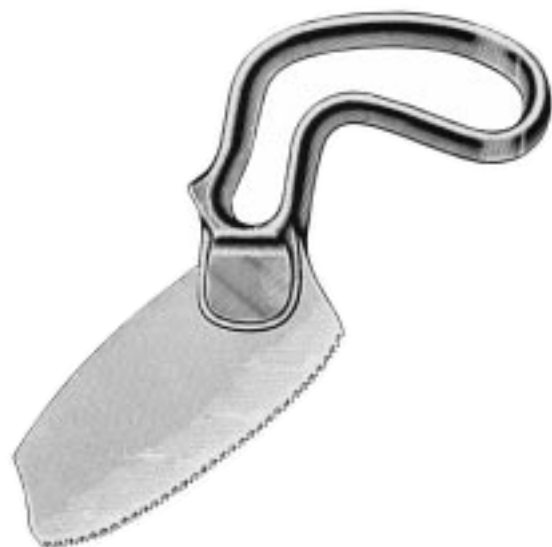
BERGMANN 21.0070 23 cm