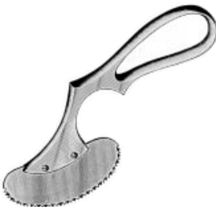
ENGEL 21.0060 16 cm