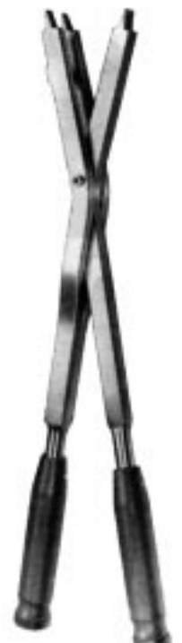
HERMANN 21.0150 46 cm